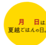
16. 夏越ごはんの日 (日付なし)