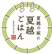
11. 夏越ごはんアイコン (ごはんなし)