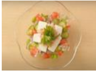
8. だしかけ夏越ごはん