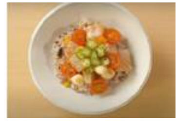
9. セビーチェ風夏越ごはん