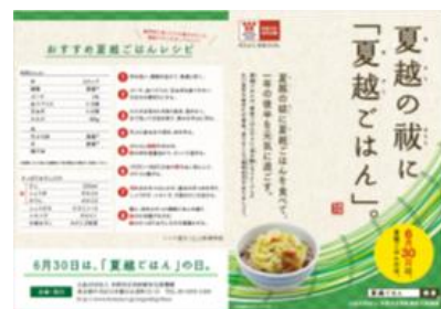
19. チラシデータ *サイズ: A4