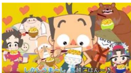
4. 夏越ごはんの唄 15 秒バージョン