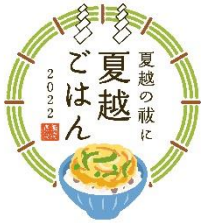
10. 夏越ごはんアイコン (ごはんあり)