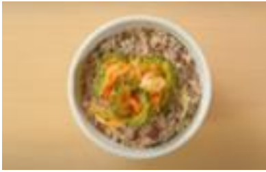
7. おすすめ夏越ごはん