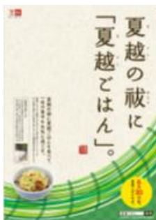
18. ポスターデータ *サイズ: B2