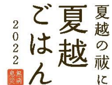
13. 夏越ごはん (文字)