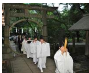
2. 「夏越の祓」(赤坂氷川神社)