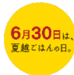
15. 夏越ごはんの日 (日付入り)