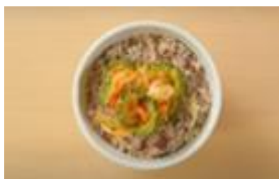
7. おすすめ夏越ごはん