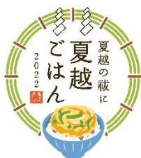
10. 夏越ごはんアイコン (ごはんあり)