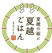
11. 夏越ごはんアイコン (ごはんなし)