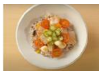
9. セビーチェ風夏越ごはん