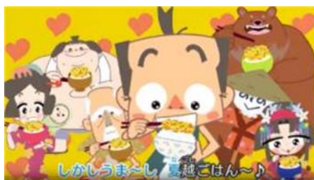
4. 夏越ごはんの唄 15 秒バージョン