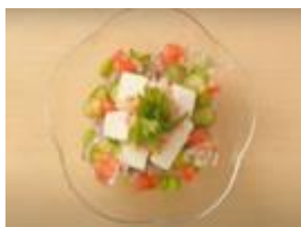
8. だしかけ夏越ごはん