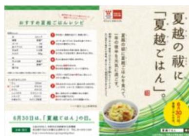
19. チラシデータ *サイズ: A4