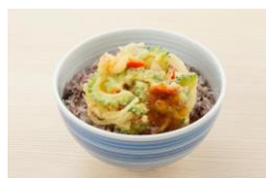
1. 夏越ごはんイメージ画像

また、画像・動画等を使用の際は、使用した原稿やデザインデータ等の提供をお願いいたします。