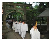
2. 赤坂氷川神社 夏越の祓