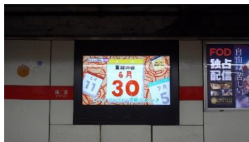
Metro Station Vision (MSV)

その他、YouTube 動画・イオンの惣菜売り場においても、『夏越ごはんの唄』の動画を放映しました。