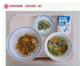
目黒区立宮前小学校 6月30日の給食