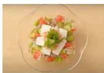
だしかけ夏越ごはん