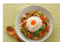
管理栄養士オリジナル 「ガパオ風夏越ごはん」