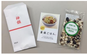
雑穀米・リーフレット

都内の神社において「夏越ごはん」のポスターの掲出のほか、「夏越の祓」のご参拝時に「夏越ごはん」を紹介したリーフレット、雑穀米を配布していただきました。協力いただく神社は年々増えており、今年は、これまでに最も多い 118 社になりました。