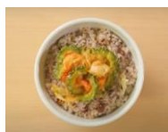
夏野菜かき揚げ夏越ごはん

ご家庭で作る「夏越ごはん」として、米穀機構の公式サイトに計3種の「夏越ごはん」の作り方を動画で紹介する他、管理栄養士が考案した、雑穀ごはんと旬の野菜を効率よく一緒に摂れるオリジナル「夏越ごはん」がWebに掲載されました。