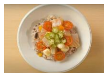
セビーチェ風夏越ごはん