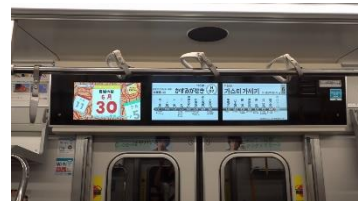
Tokyo Metro Vision