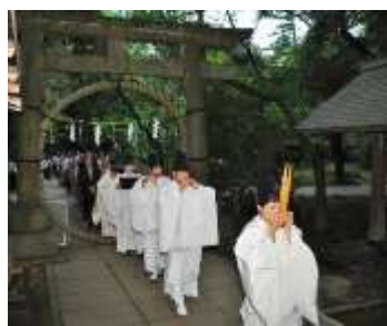
2. 赤坂氷川神社 夏越の祓 ※「赤坂氷川神社」と表記が必要