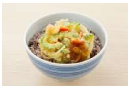
1. 夏越ごはんイメージ画像

また、画像等を使用の際は、使用した原稿やデザインデータ等の提供をお願いいたします。