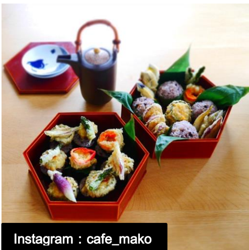
Instagram : cafe_mako

さらに、今年より、夏を元気に乗り切れるよう夏野菜を使ったメニューに、茅の輪ぐりにちなみ、食材の切り方や作り方、盛り付けで丸いモチーフを取り入れるなど、オリジナリティ溢れるアレンジを加えた「夏越ごはん」も登場。Instagramを中心にフォトジェニックな「夏越ごはん」が多数投稿され、新トレンドとして広がってきています。