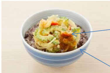
「夏越ごはん」イメージ

「夏越ごはん」は、「夏越の祓」の茅の輪の由来となった、蘇民将来(そみんしょうらい)が素盞鳴尊(すさのおのみこと)を「粟飯」でもてなしたという伝承にならった「粟」、邪気を祓う「豆」などの雑穀の入ったごはん、茅の輪をイメージした旬の夏野菜の丸いかき揚げをのせ、百邪を防ぐといわれるしょうがとレモンを効かせたさっぱりおろしだれをかけたごはんを基本としています。